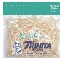
名水美人 ファクトリー株式会社様