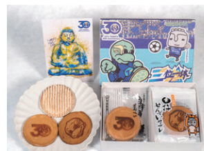
後藤製菓(うすきせんべい)様