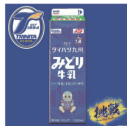
九州乳業株式会社様