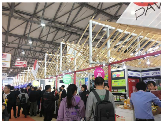
前回 (FHC 2018) ジャパンパビリオンの様子

ジェトロは、本見本市に「ジャパンパビリオン」を設置することにより、上海市場、更には中国市場全体への新規参入・販路拡大を目指す我が国企業等を支援し、同国への輸出拡大を目指します。