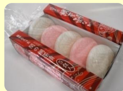
「佐賀関鯛茶漬藻なか」