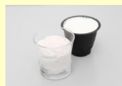
水切りヨーグルト